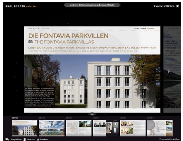
Beispiel einer Premiumpräsentation auf REAL ESTATE selected (links Übersicht, rechts Online-Exposé)