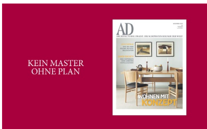
Anzeige von AD im Magazin von REAL ESTATE selected

Als stilbildender und meinungsführender Titel für Wohnen, Architektur, Interior Design und Lebensart richtet sich die Zeitschrift AD Architectural Digest an eine äußerst finanzstarke und designaffine Zielgruppe. Die Leser sind eine Klasse für sich: im besten Alter, gebildet und beruflich erfolgreich. Sie haben Stil und lieben alles Schöne. AD Architectural Digest erreicht eine verkaufte Auflage von 96.097 Exemplaren (IVW-Zahlen 4. Quartal 2010). Sie ist in den VIP-Lounges und der First und Business Class ausgewählter Fluglinien von Lufthansa bis Emirates ebenso zu finden wie bei führenden Möbelhändlern und auf den wichtigsten Design- und Kunstmessen.