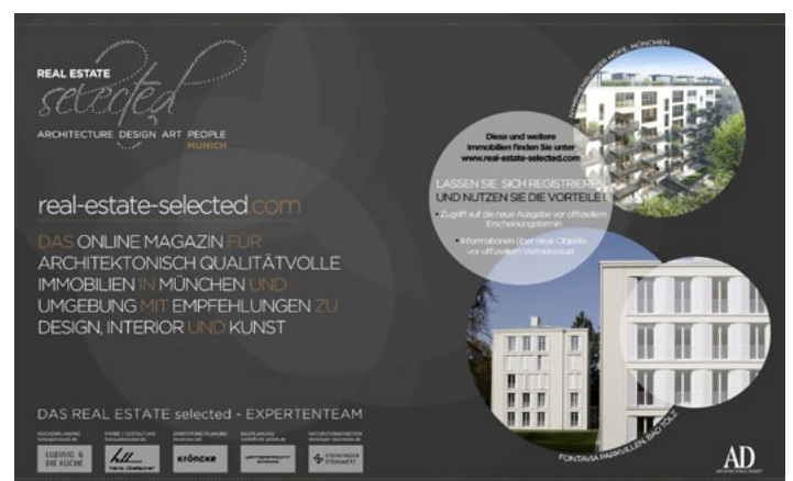
Doppelseitige Anzeige von REAL ESTATE selected in AD

Im Rahmen der Kooperation von BE URBAN mit dem Condé Nast-Verlag kann REAL ESTATE selected Bauträgern spezielle "classified"-Immobilienanzeigen in AD Architectural Digest zu Sonderkonditionen anbieten.